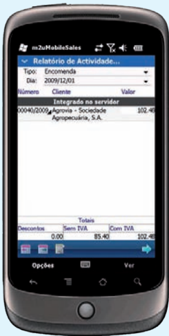
Relatório de Actividade