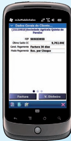
Dados Gerais do Cliente

despesas, Kms realizados e folhas de caixa. O PRIMAVERA Mobile Business Servidor permite ainda a consulta de alterações de dados de clientes e registos de novos clientes efectuados nos postos móveis, manutenção de um conjunto de frases tipo, para vários cenários, de forma a tornar mais rápida a escrita de informação complementar em documentos ou nos relatórios de visita. É mantido para consulta no backOffice, um registo detalhado de todas as sincronizações realizadas pelos PDA, de forma a permitir a detecção de eventuais problemas de sincronização ou comunicação. O backOffice é também responsável pelo interface de comunicação entre a aplicação e o sistema de gestão central.